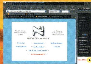
Cambia veste con Neoplanet